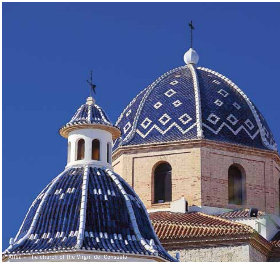
Altea – The church of the Virgin del Consuelo