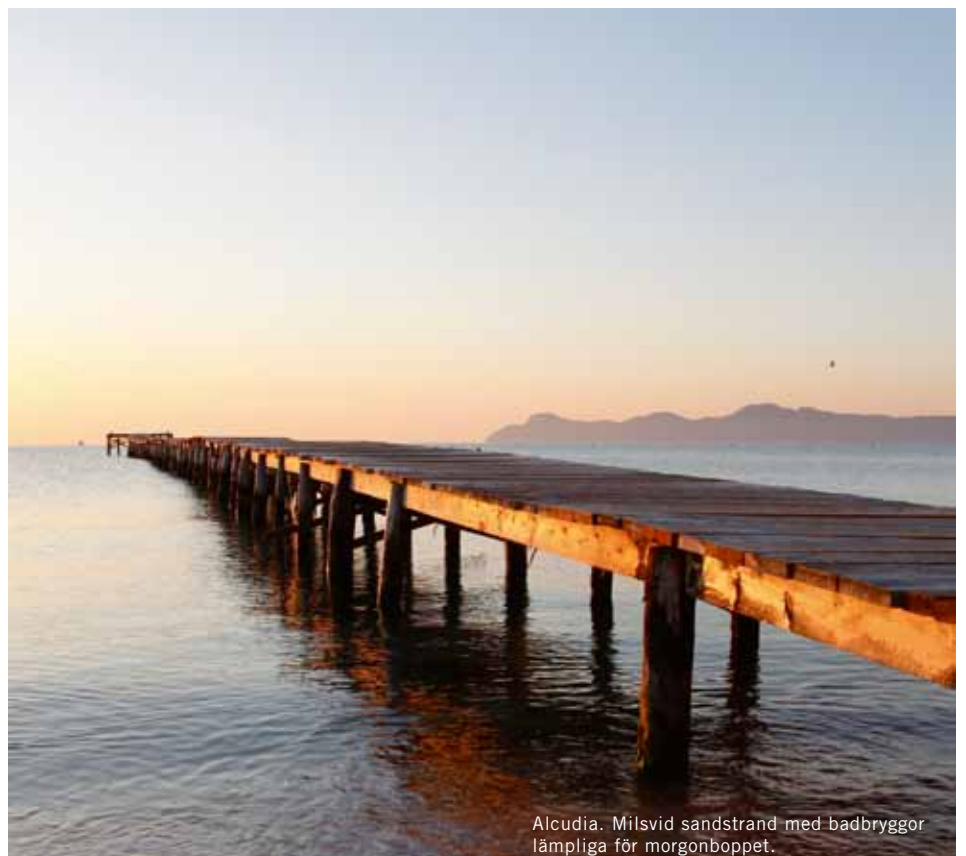
Alcudia. Milsvid sandstrand med badbryggor lämpliga för morgonboppet.

La Bodeguilla (ligger intill Placa Rei Joan Carlos) har modern och utsökt tapas med ett imponerande urval av viner. ●