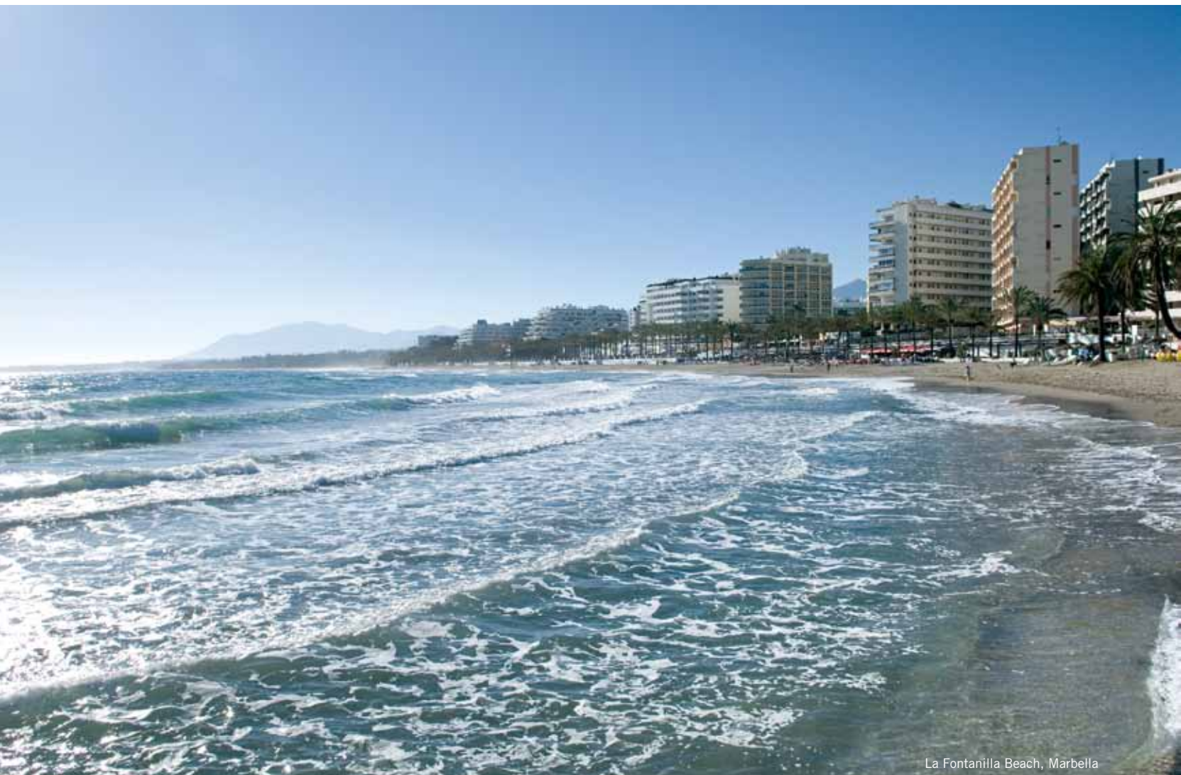
La Fontanilla Beach, Marbella