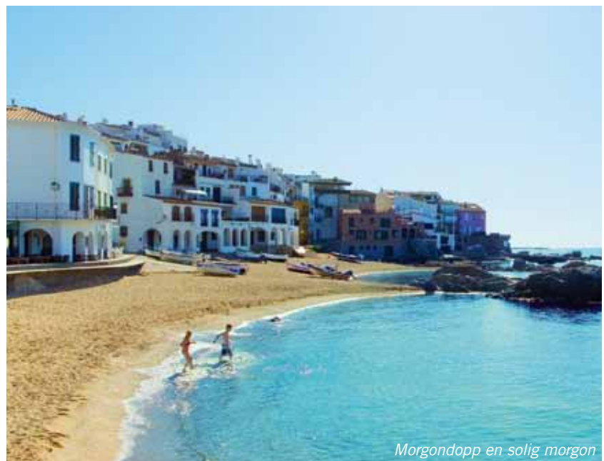
Morgondopp en solig morgon