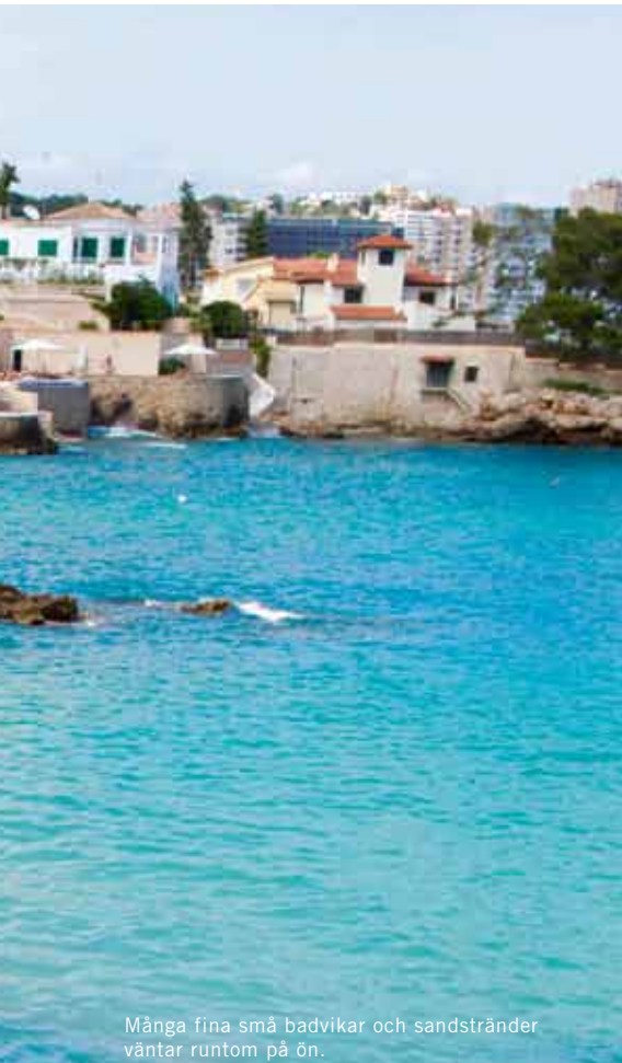
Många fina små badvikar och sandstränder väntar runtom på ön.