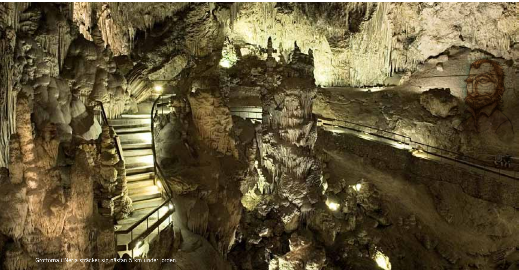
Grottorna i Nerja sträcker sig nästan 5 km under jorden.

N är sensommaren kryper närmare varvar spanjorerna ner. Trafikstressen försvinner med värmeböljan och turisthetsen blir mindre påtaglig. Den spanska genuiniteten tittar fram efter en lång siesta och Costa del Sol visar sig från sin rätta sida – den sida som en gång lockade de första turisterna hit.